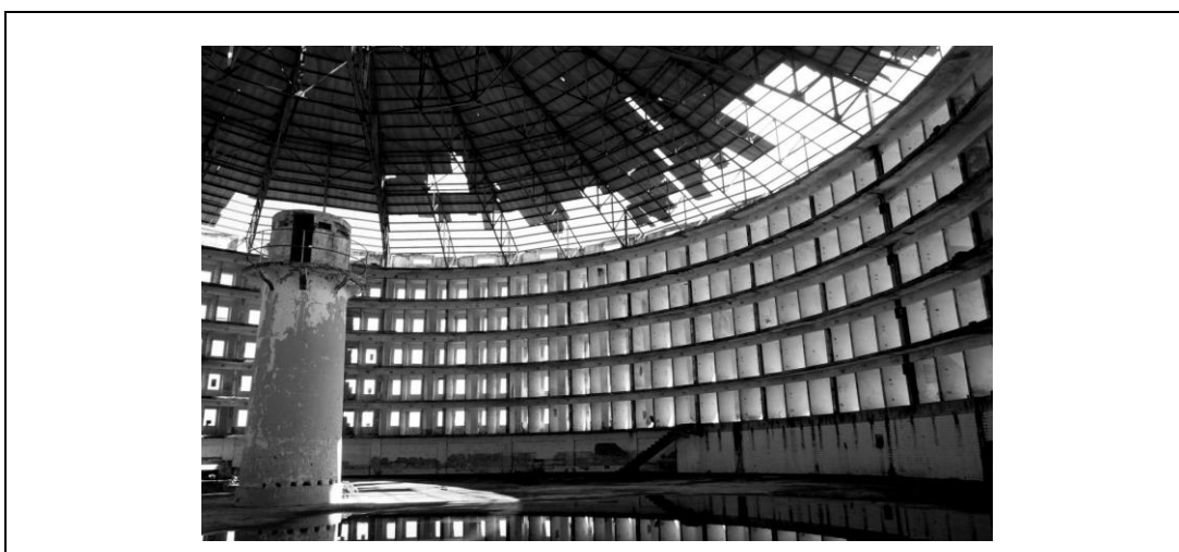
Figura 2 – Presídio Modelo (Ilha da Juventude, Cuba, 1925-1973).

Fonte: Disponível em: < http://isladelajuventud-cuba.com/ >.